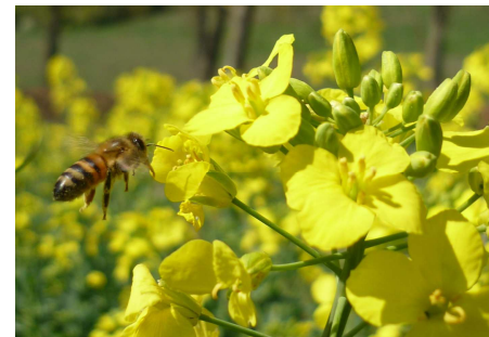
Bild 4: Die Honigbiene befliegt den Raps etwas bis 17 Uhr. Die Wildbienen aber deutlich länger!

Und hier noch einmal der Hinweis: Für die Fungizide Propulse und Propyram 250SE besteht eine Bienenschutzauflage, wenn sie mit einem Pyrethroid gemischt werden (siehe Tabelle 3)! Wenn Fungizide, für die bei der Anwendung gegen die Weißstängeligkeit keine spezifische Bienenschutzauflage besteht, aber mit einem Insektizid zur Bekämpfung der Schotenschädlinge gemischt werden sollen, so gilt die Bienenschutzauflage des Insektizids.