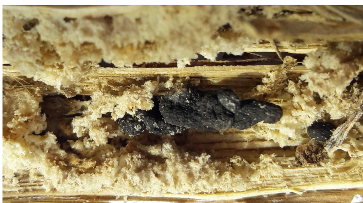
Bild 2: Dauersporen im Haupttrieb. Grundsätzlich gilt: je grösser und schwerer die Dauerspore, desto früher keimt sie in den Folgejahren

Für Infektion der Rapspflanzen durch den Erreger der Weißstängeligkeit sind folgende Faktoren nötig sind: eine enge Fruchtfolge von 3 bis 4 Jahren, ausreichend Bodenfeuchte vor der Rapsblüte mit Bodentemperaturen über 7°C, zur Vollblüte dann mindestens 10 Stunden Blattnässe im Bestand und Temperaturen über 18 °C. Pflanzen, die von der Weißstängeligkeit befallen sind, reifen frühzeitig ab und zeigen grau-weißliche Verfärbungen im unteren Bereich der Haupttriebe. Das Stängelinnere ist mehr oder weniger hohl und mit flockigem Myzel gefüllt, in denen die rundlichen schwarzen Dauersporen ruhen ( Bild 2 ). Nach dem Drusch und der Einarbeitung der Stoppel gelangen die Dauersporen in den Boden, wo sie jahrelang ruhen können. Hier kann in intensiven Rapsfruchtfolgen vorbeugend das Produkt „Lalstop Contans WG“ helfen (in der Tabelle 1 nicht aufgeführt, da es in der prophylaktischen Anwendung nach der Ernte eingesetzt wird, um die Dauersporen im Boden langfristig zu minimieren).