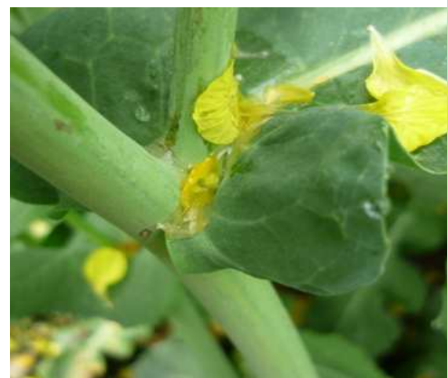
Bild 1: Hier herrschen optimale Bedingungen für die Infektion

Für die Rapsschläge in der Blüte stellt sich die Frage der Vollblütenapplikation, d.h. Bekämpfung der Weißstängeligkeit ( Sclerotinia sclerotiorum ). Die Weißstängeligkeit ist besonders auf denjenigen Schlägen verbreitet, in denen der Raps in einer engen Fruchtfolge (3 Jahre) angebaut wird. Die Dauerfruchtkörper (Sklerotien) dieser Pilzkrankung lagern sich im Boden an und sind etwa 7-10 Jahre lebensfähig. Aus den Dauersporen bilden sich die so genannten Apothecien (die Becherfrüchte), in denen sich die Ascosporen (Schlauchsporen) befinden. Diese Sporen werden durch den Wind verbreitet und infizieren den Raps. Blattnässe und Temperaturen von 15-20 °C begünstigen die Keimung der Sporen, die insbesondere unter den abgefallenen Blütenblättern in den Blattachseln und Gabelungen am Haupttrieb stattfindet ( Bild 1 ).